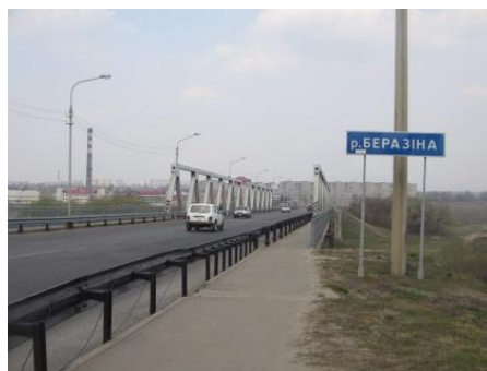
Фото 3. Мост через реку Березина.