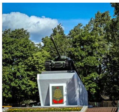
Фото 4. Памятник экипажу Павла Рака