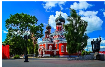
Фото 5. Микрорайон Старый город. Свято-Воскресенский Кафедральный Собор